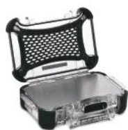
Ensemble de panneaux en aluminium