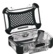
Ensemble de panneaux en Lexan